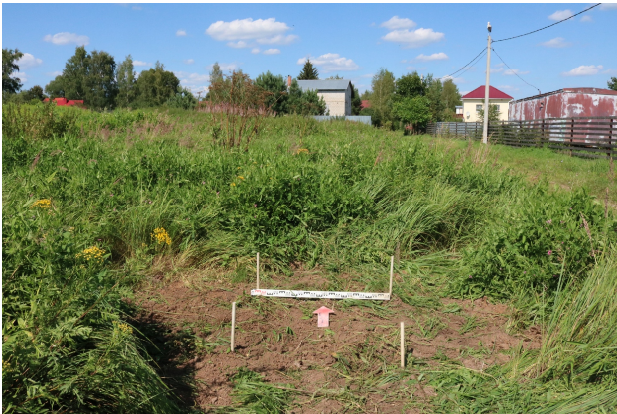
Рис. 20. Археологическое обследование участка по объекту: «Уличные газопроводы дер. Волхонское Бабынинского района Калужской области». 2023 г. Шурф 1. Рекультивация. Вид с Ю.