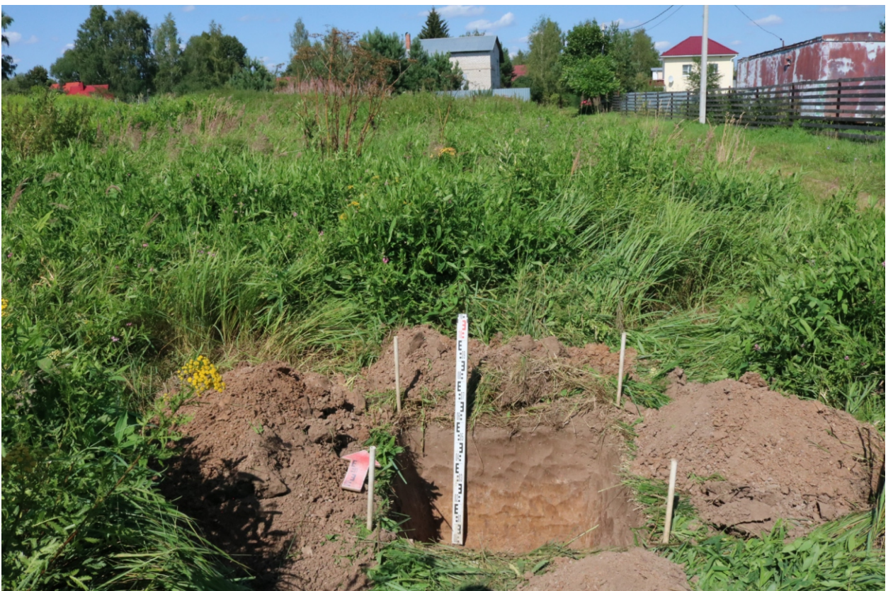
Рис. 17. Археологическое обследование участка по объекту: «Уличные газопроводы дер. Волхонское Бабынинского района Калужской области». 2023 г. Шурф 1. Общий вид с Ю после завершения работ.