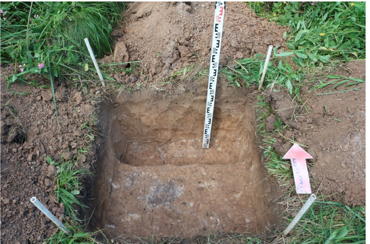
Рис. 23. Археологическое обследование участка по объекту: «Уличные газопроводы дер. Волхонское Бабынинского района Калужской области». 2023 г. Шурф 2. Материк (контрольный прокоп). Вид с Ю.