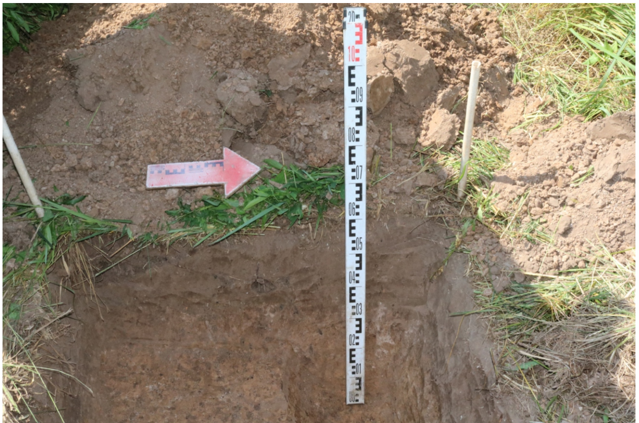
Рис. 19. Археологическое обследование участка по объекту: «Уличные газопроводы дер. Волхонское Бабынинского района Калужской области». 2023 г. Шурф 1. Западный борт. Вид с В.