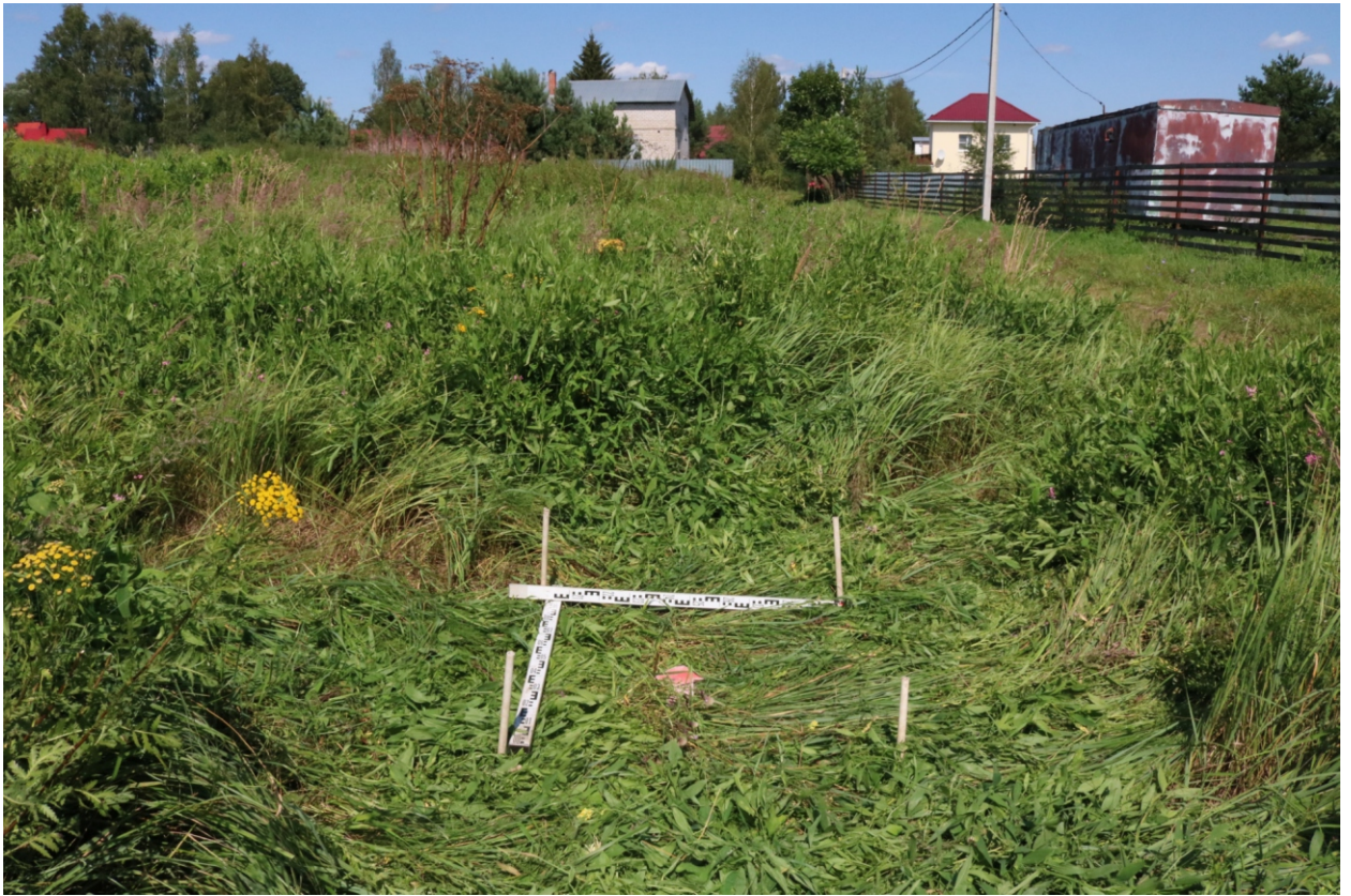
Рис. 16. Археологическое обследование участка по объекту: «Уличные газопроводы дер. Волхонское Бабынинского района Калужской области». 2023 г. Шурф 1. Общий вид с Ю до начала работ.