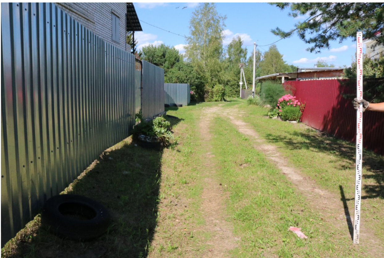
Рис. 9. Археологическое обследование участка по объекту: «Уличные газопроводы дер. Волхонское Бабынинского района Калужской области». 2023 г. Точка фотофиксации 1. Вид с ЮЗ.