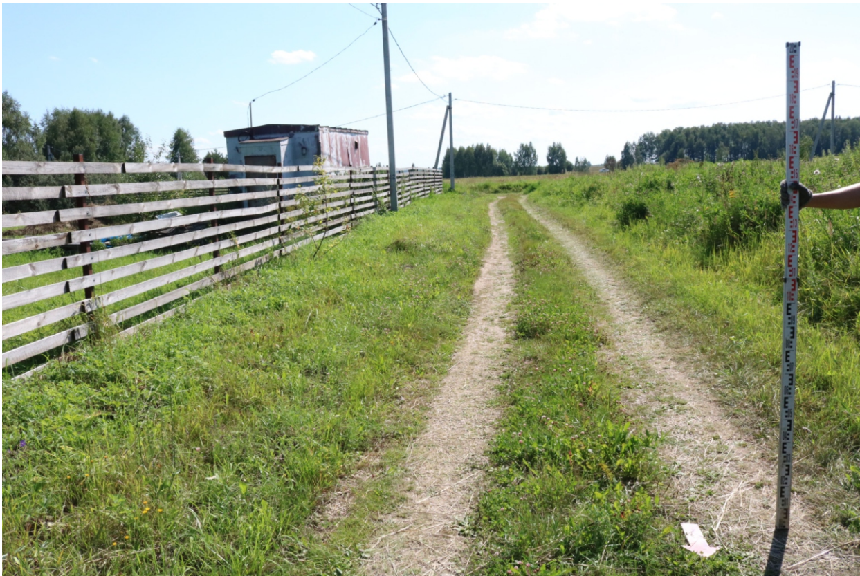
Рис. 8. Археологическое обследование участка по объекту: «Уличные газопроводы дер. Волхонское Бабынинского района Калужской области». 2023 г. Точка фотофиксации 1. Вид с С.