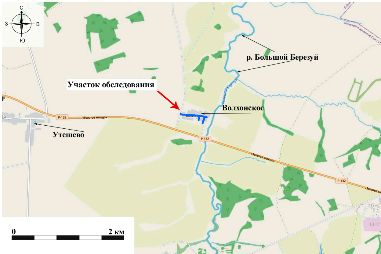
Рис. 3. Археологическое обследование участка по объекту: «Уличные газопроводы дер. Волхонское Бабынинского района Калужской области». 2023 г. Ситуационный план участка обследования.