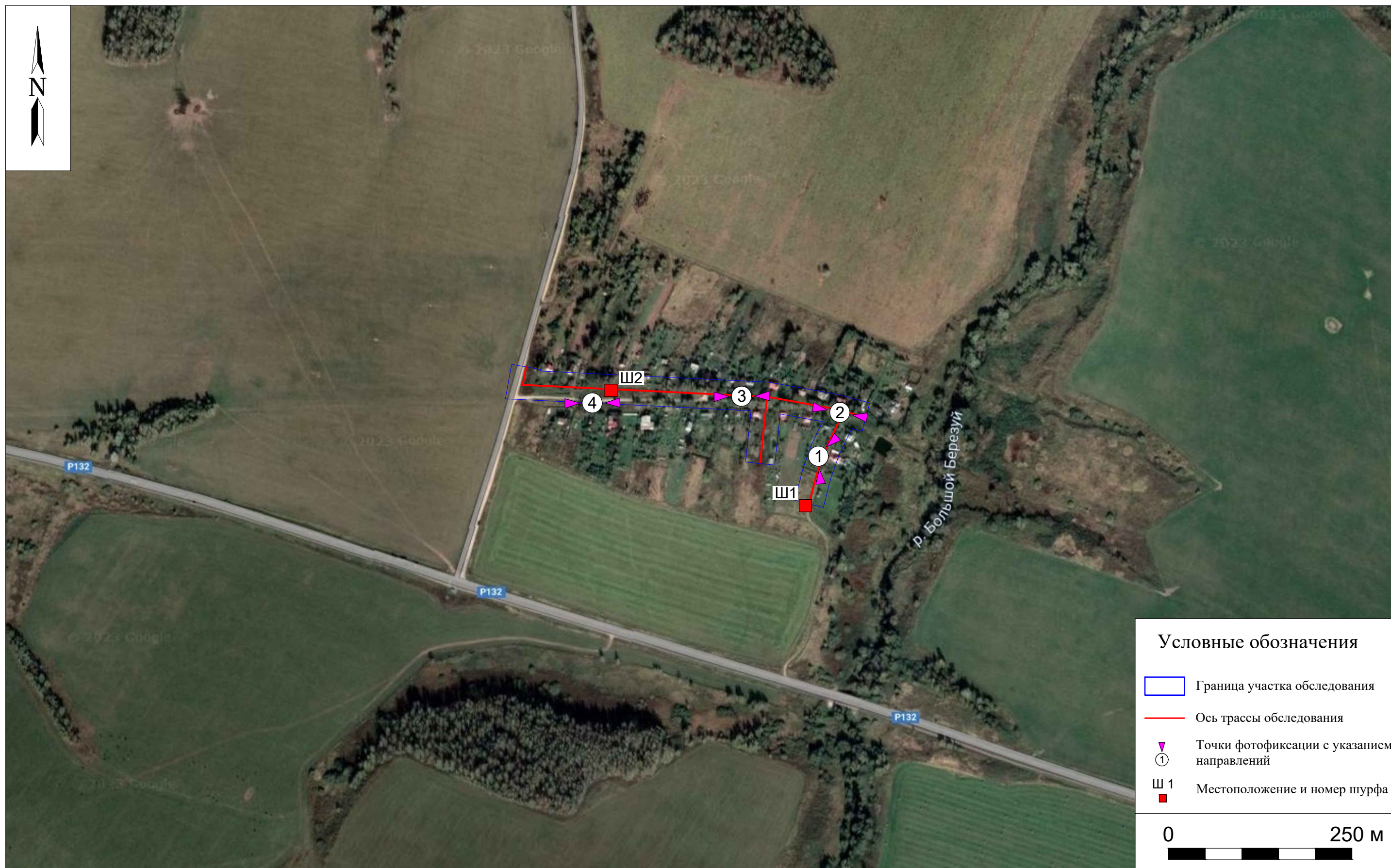
Рис. 7. Археологическое обследование участка по объекту: «Уличные газопроводы дер. Волхонское Бабынинского района Калужской области». 2023 г. Ось трассы обследования на космоснимке 2022 г. с указанием местоположения точек фотофиксаций и шурфов.