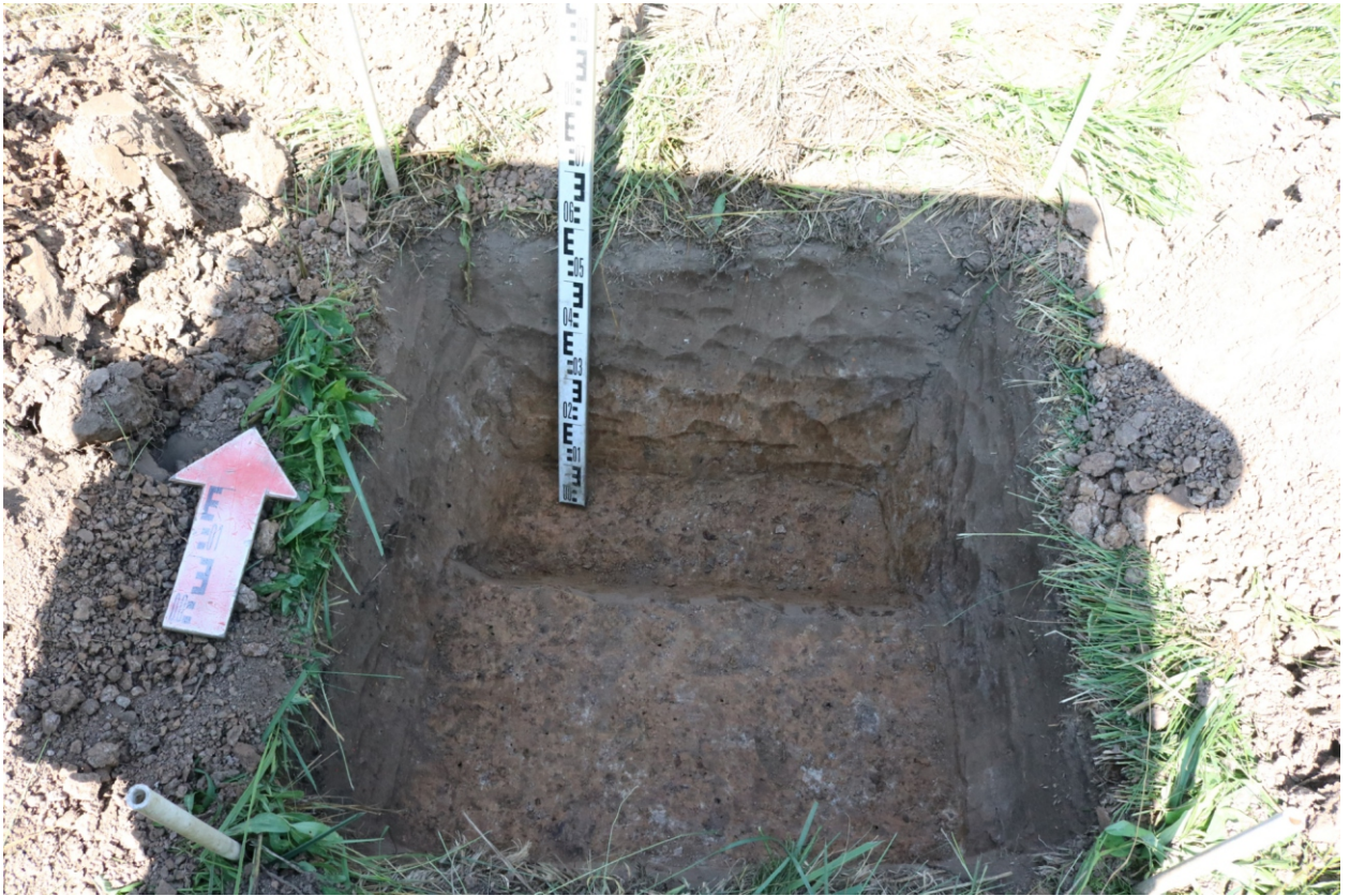
Рис. 18. Археологическое обследование участка по объекту: «Уличные газопроводы дер. Волхонское Бабынинского района Калужской области». 2023 г. Шурф 1. Материк (контрольный прокоп). Вид с Ю.