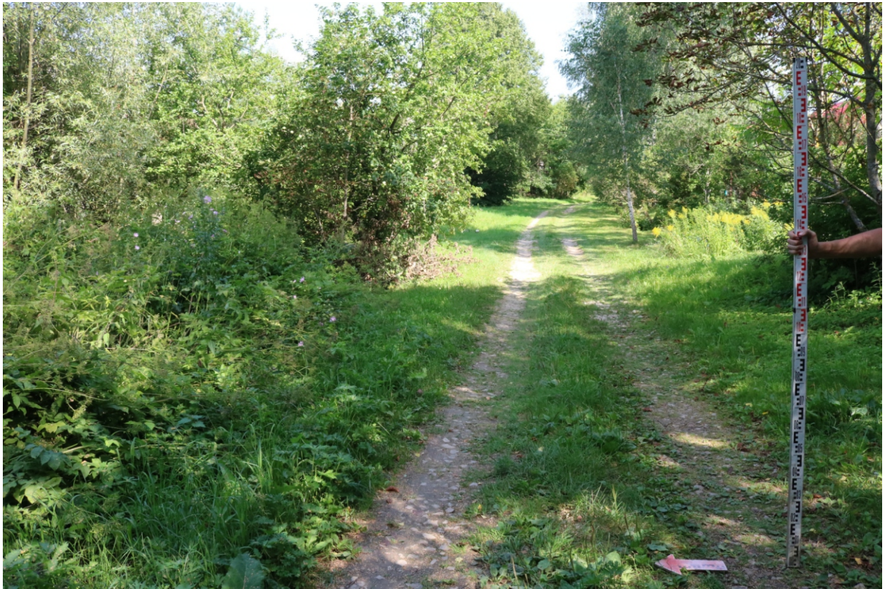
Рис. 12. Археологическое обследование участка по объекту: «Уличные газопроводы дер. Волхонское Бабынинского района Калужской области». 2023 г. Точка фотофиксации 3. Вид с З.