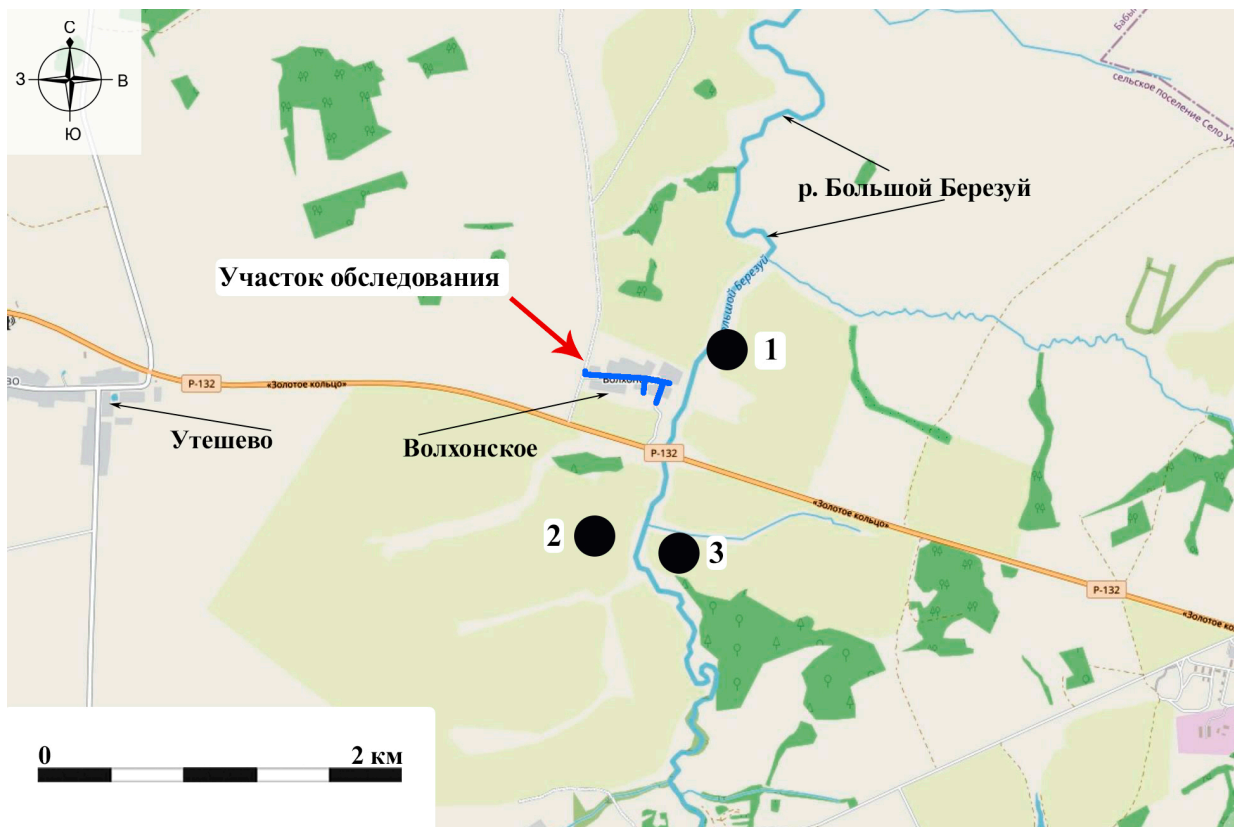
Рис. 4. Археологическое обследование участка по объекту: «Уличные газопроводы дер. Волхонское Бабынинского района Калужской области». 2023 г. Ситуационный план местности с указанием участка обследования и ближайшими объектами археологического значения.