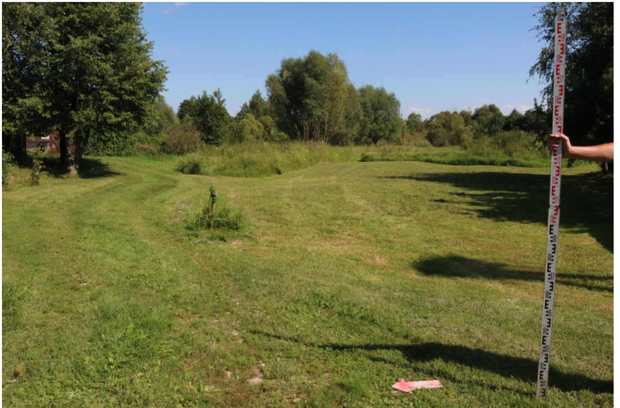
Рис. 10. Археологическое обследование участка по объекту: «Уличные газопроводы дер. Волхонское Бабынинского района Калужской области». 2023 г. Точка фотофиксации 2. Вид с 3.