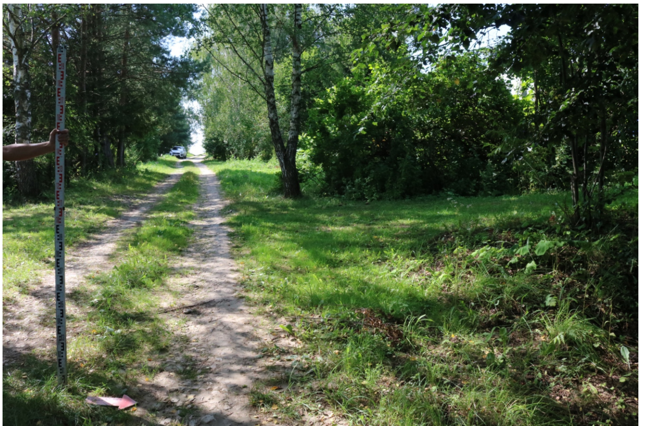
Рис. 13. Археологическое обследование участка по объекту: «Уличные газопроводы дер. Волхонское Бабынинского района Калужской области». 2023 г. Точка фотофиксации 3. Вид с В.