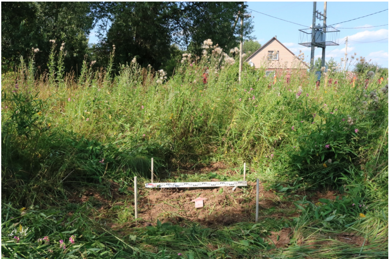
Рис. 25. Археологическое обследование участка по объекту: «Уличные газопроводы дер. Волхонское Бабынинского района Калужской области». 2023 г. Шурф 2. Рекультивация. Вид с Ю.