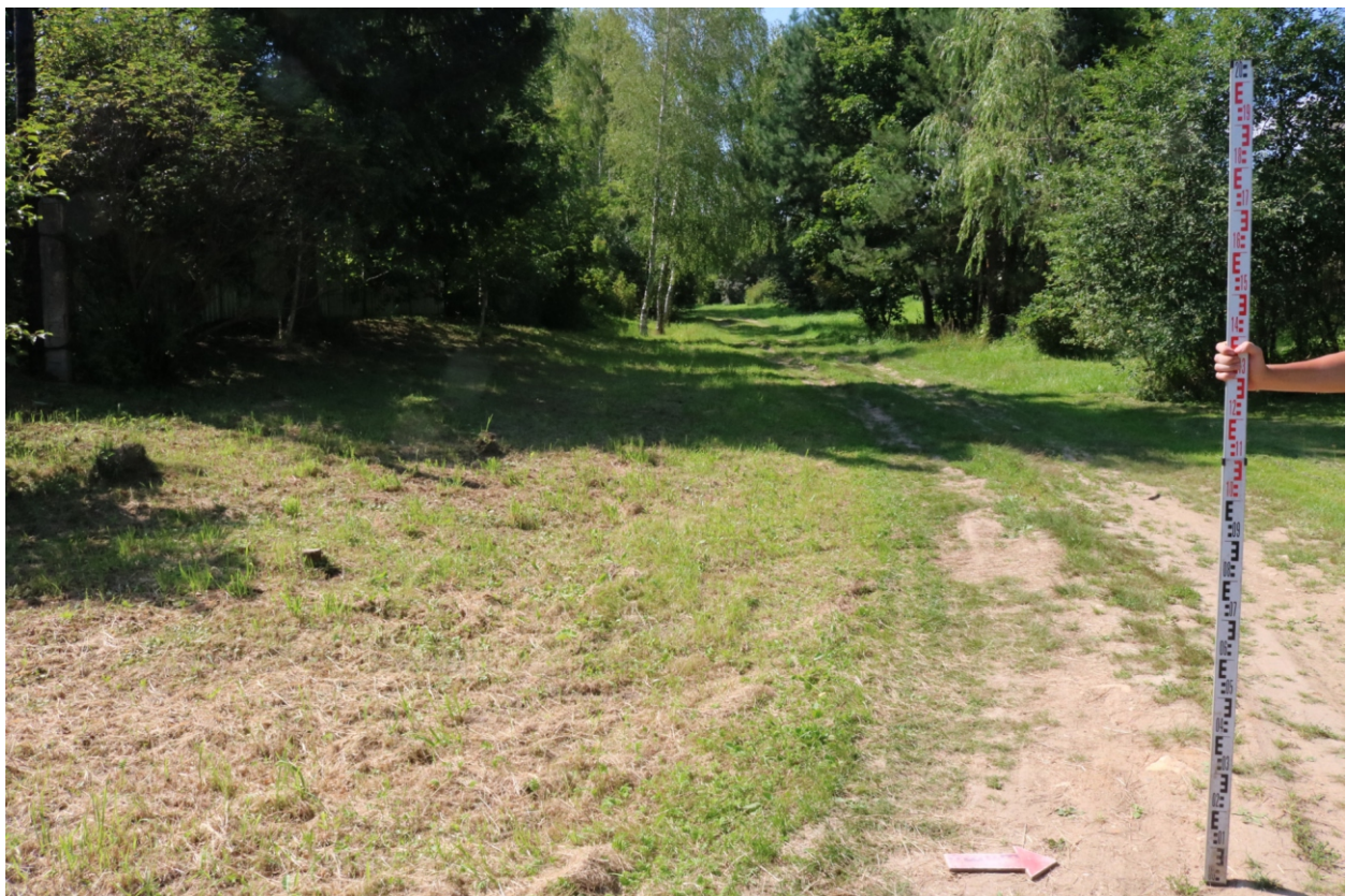
Рис. 11. Археологическое обследование участка по объекту: «Уличные газопроводы дер. Волхонское Бабынинского района Калужской области». 2023 г. Точка фотофиксации 2. Вид с В.