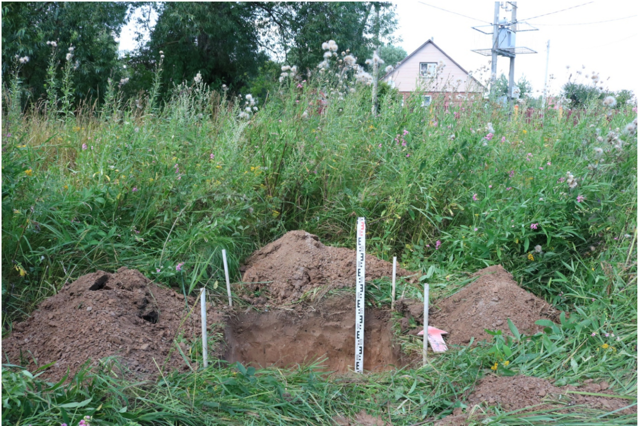
Рис. 22. Археологическое обследование участка по объекту: «Уличные газопроводы дер. Волхонское Бабынинского района Калужской области». 2023 г. Шурф 2. Общий вид с Ю после завершения работ.