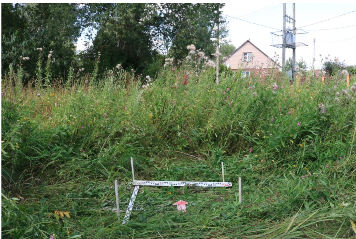
Рис. 21. Археологическое обследование участка по объекту: «Уличные газопроводы дер. Волхонское Бабынинского района Калужской области». 2023 г. Шурф 2. Общий вид с Ю до начала работ.