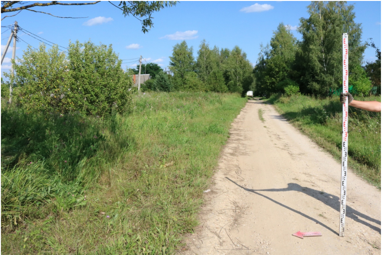
Рис. 14. Археологическое обследование участка по объекту: «Уличные газопроводы дер. Волхонское Бабынинского района Калужской области». 2023 г. Точка фотофиксации 4. Вид с З.