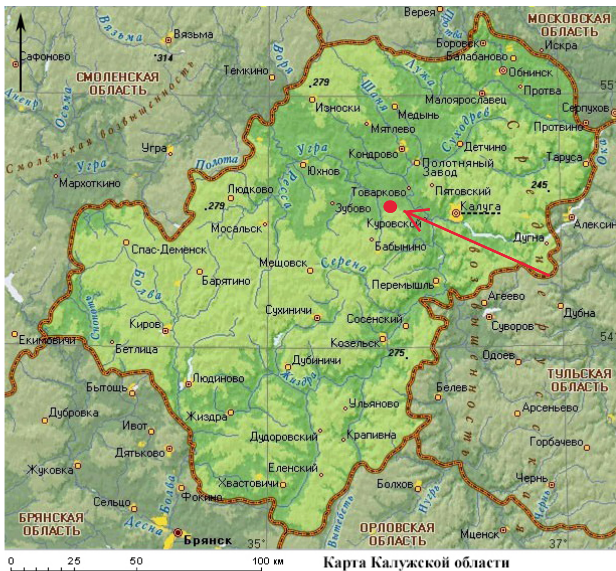
Рис. 2. Археологическое обследование участка по объекту: «Уличные газопроводы дер. Волхонское Бабынинского района Калужской области». 2023 г. Калужская область на схеме Центрального федерального округа. Карта Калужской области с указанием местоположения участка обследования.