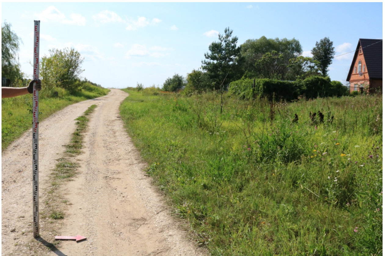
Рис. 15. Археологическое обследование участка по объекту: «Уличные газопроводы дер. Волхонское Бабынинского района Калужской области». 2023 г. Точка фотофиксации 4. Вид с В.