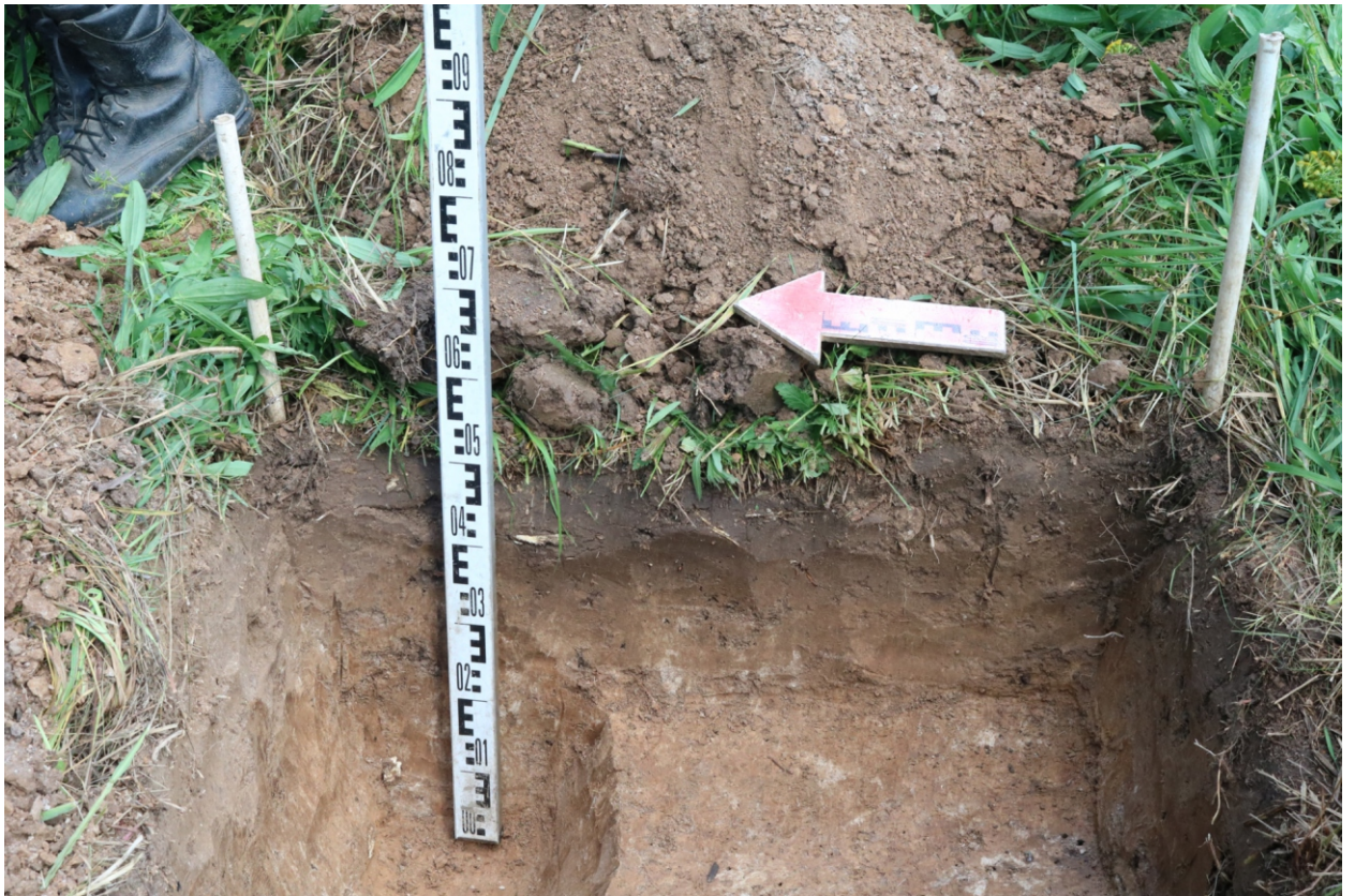
Рис. 24. Археологическое обследование участка по объекту: «Уличные газопроводы дер. Волхонское Бабынинского района Калужской области». 2023 г. Шурф 2. Восточный. Вид с З.